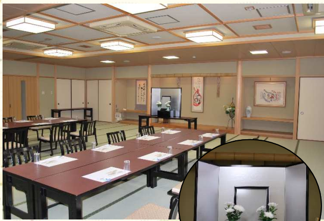
会場一例(西吉野の間)