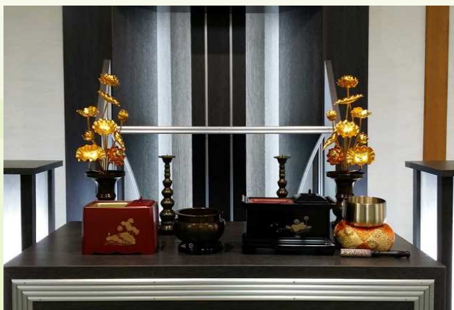
(常花をご用意しておりますが、生花が必要な場合はご持参ください)